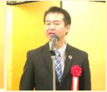
ご来賓挨拶 株式会社マツキヨココカラ&カンパニー 執行役員グループ管理統括人事戦略室長