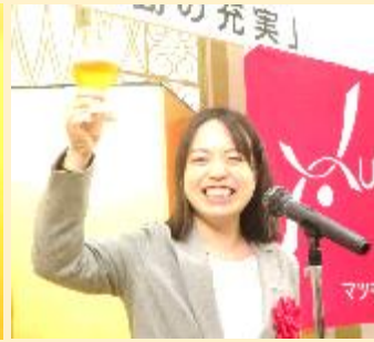
乾杯挨拶 ツルハユニオン 中央執行委員長