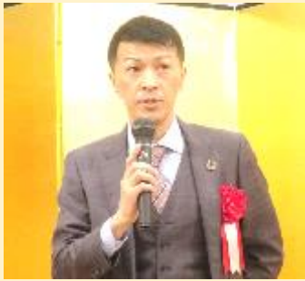
ご来賓挨拶 株式会社マツモトキョシ 取締役 店舗運営本部ドラッグストア 事業部長